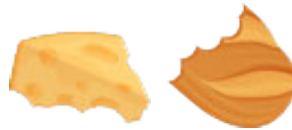
Restes de repas (y compris plats en sauce)