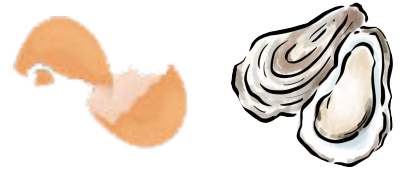
Coquilles d'oeufs, de noix, d'huîtres et de moules