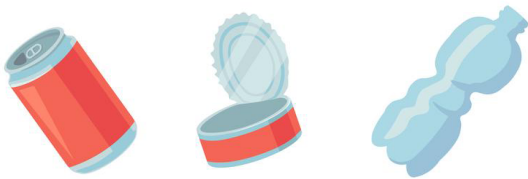
Emballages plastiques et métalliques