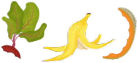
Epluchures, agrumes, fruits gâtés, légumes avariés