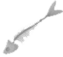
Restes et arêtes de poissons